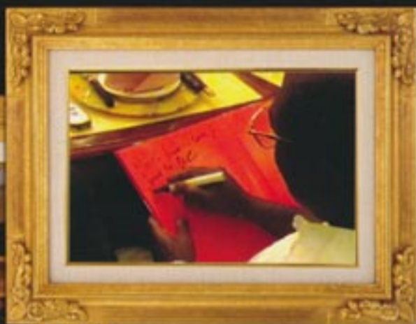
喀麦隆共和国驻华大使埃蒂安先生题字